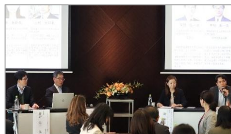
▲パネルディスカッション登壇者