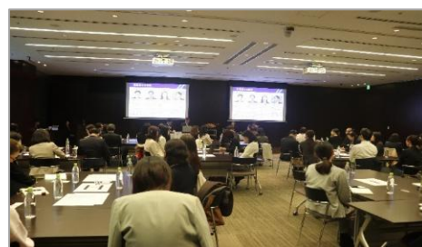
▲パネルディスカッションの様子

第二部のグループディスカッションでは、対面参加者が「育児との両立」「介護との両立」「部下のキャリア育成支援」「自分らしいキャリア」の4つのグループに分かれ、各テーマについてディスカッションを行いました。参加者からは、「同業他社の方々と年齢・部署を超え、悩みを共有できたのは大変貴重な経験でした。」「参加者の皆さまが前向きで、他社好事例なども伺い大変参考になりました。」といった感想が挙がりました。