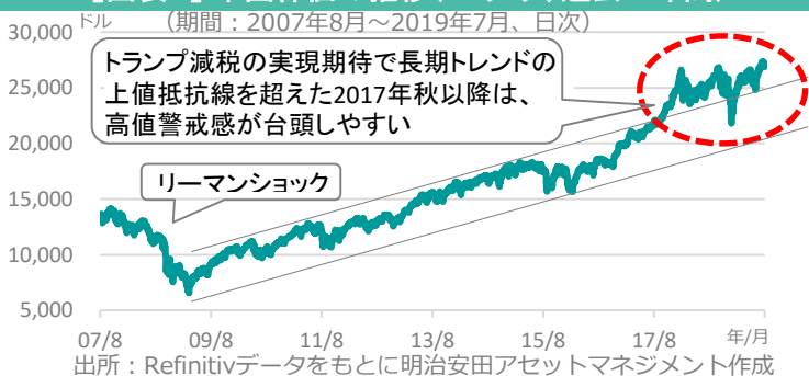
【図表1】米国株価の推移(NYダウ、過去12年間)

●当資料は、明治安田アセットマネジメント株式会社がお客さまの投資判断の参考となる情報提供を目的として作成したものであり、投資勧誘を目的とするものではありません。また、法令にもとづく開示書類(目論見書等)ではありません。当資料は当社の個々のファンドの運用に影響を与えるものではありません。●当資料は、信頼できると判断した情報等にもとづき作成していますが、内容の正確性、完全性を保証するものではありません。●当資料に指数・統計資料等が記載される場合、それらに関する著作権等の一切の権利は、それらを作成・公表している各主体に帰属します。●当資料の内容は作成日における筆者の個人的見解に基づいており、将来の運用成果を示唆あるいは保証するものではありません。また予告なしに変更することもあります。●投資に関する最終的な決定は、お客さま自身の判断でなさるようお願いいたします。