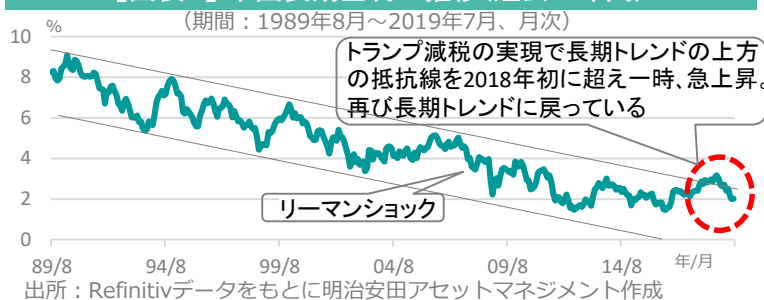
【図表2】米国長期金利の推移(過去30年間)