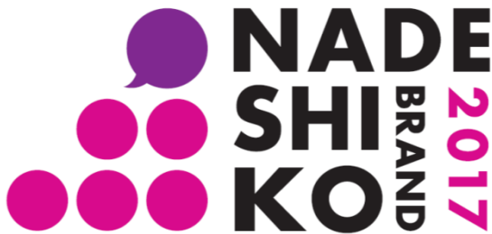
2016年度「なでしこ銘柄」ロゴマーク (2017年3月発表)